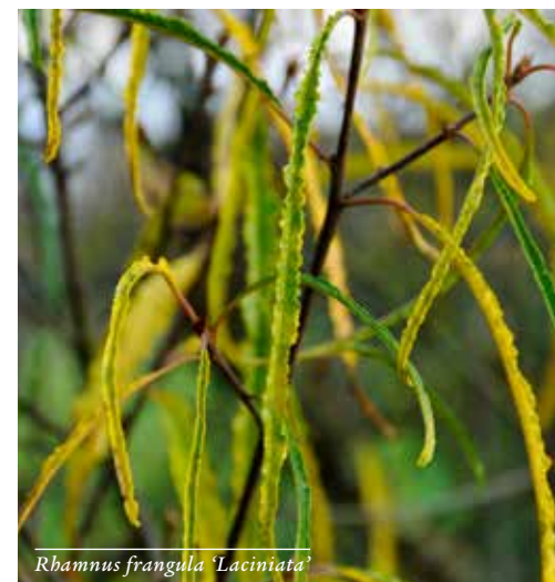
Rhamnus frangula 'Laciniata'