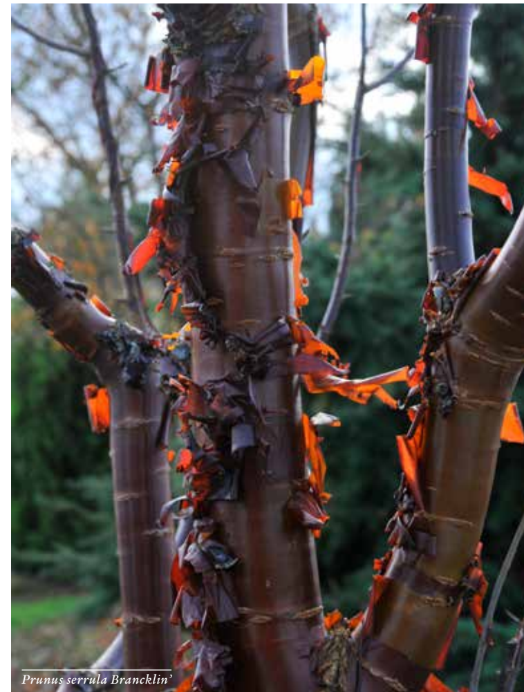
Prunus serrula 'Branklin'