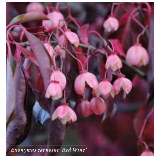
Euonymus carnosus 'Red Wine'