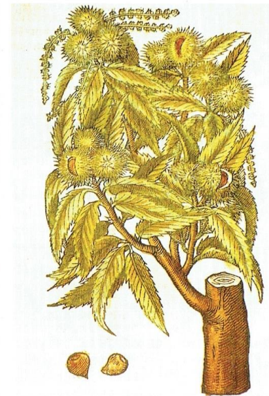
Pl. 274. 'Castanieboom' (Tamme Kastanje). Uit: Lobelius' Kruidtboeck ... (1581).

Veel prachtige tekeningen en duidelijke foto's maken dit boek tot een bijzonder naslagwerk waar ook zonder een duidelijke reden niet alleen in gelezen, maar ook in weggedroomd kan worden. Dit omvangrijk werk is een 'must have' voor de echte plantenliefhebber. □